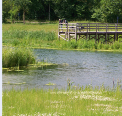
Uitrusten en natuurlijken vanop de steiger

De overstromingszone werd voorzien van een wandelpad op de dijken, een Finse piste rond de zone, een knuppelpad dwars door het gebied en een steiger. De hellingsgraad van de taluds rond de poelen varieert in functie van de oriëntatie. In de overstromingszone kunnen vele plantensoorten zich spontaan ontwikkelen. Bovendien is dit project een eerste aanzet om het enorme vismigatieknelpunt op de Cicindriabeek op te lossen. Hierdoor ontstaat een open en waardevol biotoop.