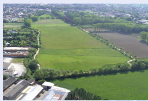
Toestand van 't Speelhof in 2004

In 2008 werd een 8 ha groot akkerland in het domein omgevormd tot een gecontroleerde overstromingszone. De Trudobronbeek werd 'bevrijd' uit zijn strak keurslijf en kreeg een nieuwe kronkelende loop dwars door de overstromingszone, aangevuld met verschillende poelen. Het gebied werd afgeboord met een dijk. In tijden van nood kan ook het teveel aan water in de Cicindriabeek gecontroleerd worden opgevangen in deze zone. Dit betekent een bijkomende beveiliging tegen wateroverlast voor de stroomafwaarts gelegen dorpskernen.