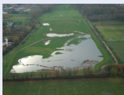
Waterberging in de overstromingszone

Met de aanleg van een gecontroleerd overstromingsgebied, direct afwaarts van de verharde stadskern van Sint-Truiden, streeft de stad naar een concrete invulling van de principes van integraal waterbeheer. Hiermee geeft het stadsbestuur het goede voorbeeld aan burgers en bedrijven om nieuwe verhardingen te compenseren door opvang en infiltratie.