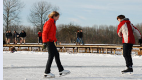
Winterpret op de dichtgevroren poelen

De nieuwe inrichting van 't Speelhof is een prachtige illustratie van integraal waterbeleid. Een stukje van Sint-Truiden mag 'verwateren' tot natuur in 't Speelhof.