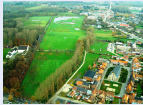
Luchtfoto van het domein 't Speelhof

Het domein 't Speelhof ligt op enkele honderden meter van de Grote Markt van Sint-Truiden. Gezien de grote potenties, heeft het stadsbestuur, die eigenaar is van het domein, beslist om het uit te bouwen tot een ecologisch, historisch, toeristisch en recreatief aantrekkelijke plaats.