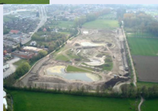
Toestand tijdens de werken in 2008

Met de aanleg van een gecontroleerd overstromingsgebied, direct afwaarts van de verharde stadskern van Sint-Truiden, streeft de stad naar een concrete invulling van de principes van integraal waterbeheer. Hiermee geeft het stadsbestuur het goede voorbeeld aan burgers en bedrijven om nieuwe verhardingen te compenseren door opvang en infiltratie.