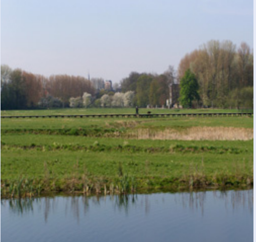
Wandelen over het knuppelpad

De zone leent zich dan ook uitstekend voor educatie over integraal waterbeheer en is een paradijs geworden voor wandelaars, joggers vogelspotters, jeugdbewegingen, ... In de winterperiode wordt er zelfs geschaatst op de dichtgevroren poelen.