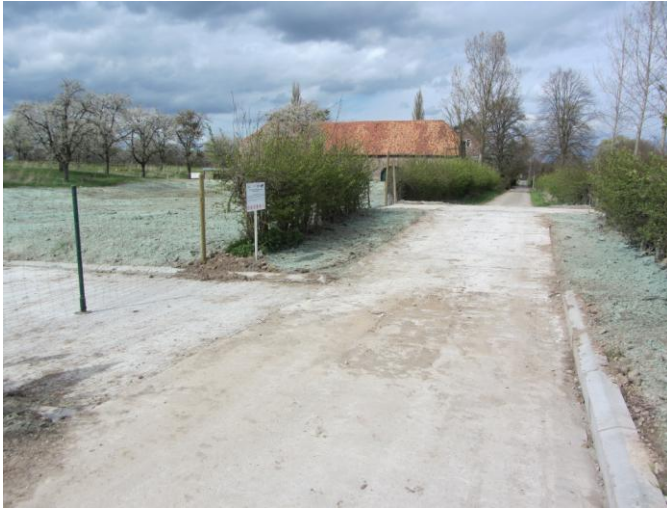
Drempel in de Henisdaelstraat om water- en modderstromen af te leiden naar opvangsysteem (Vechmaal)