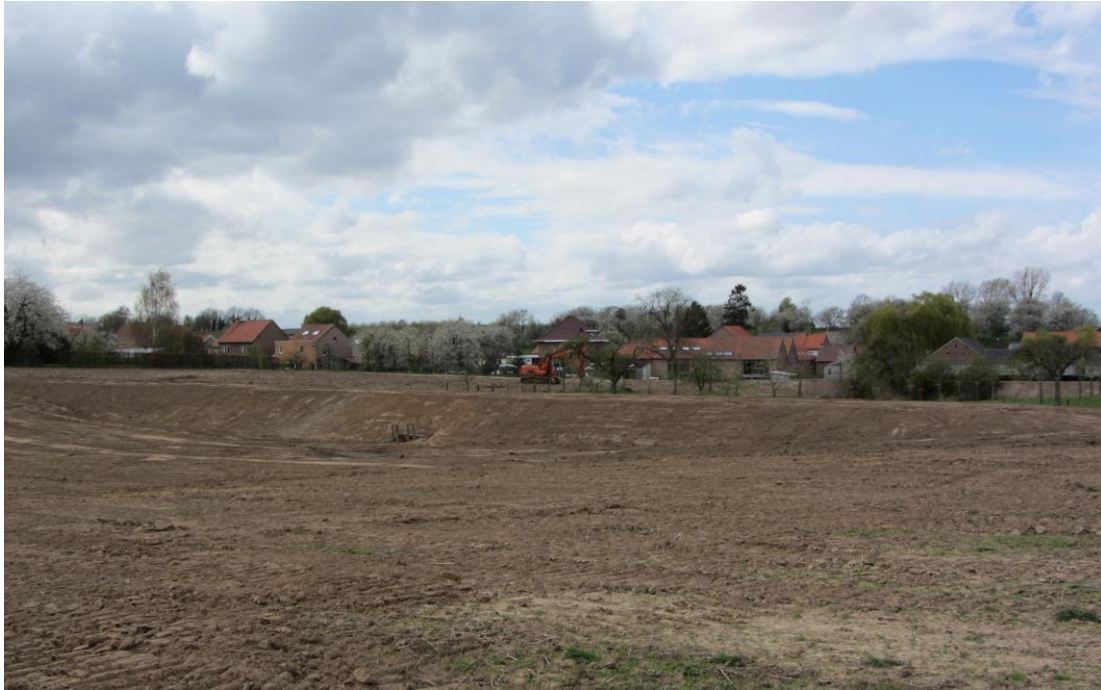
Damconstructie 2 en erosiepoel om de water- en modderstromen op te vangen (Opheers)