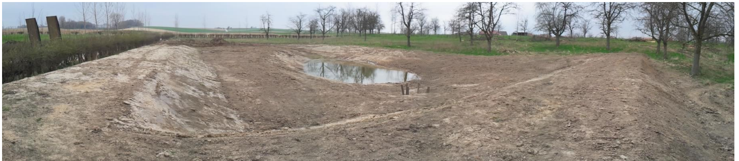
Damconstructie en erosiepoel om de water- en modderstromen op te vangen (Vechmaal)