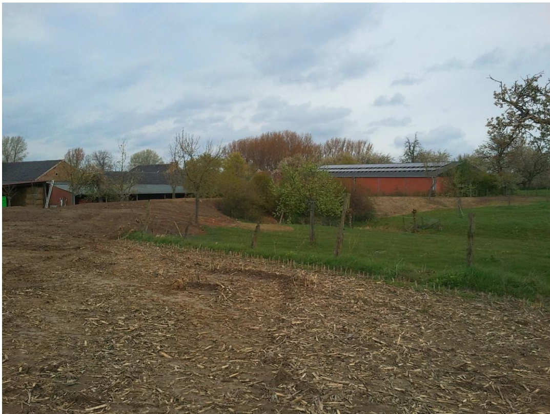
Damconstructie 1 en erosiepoel (Opheers)