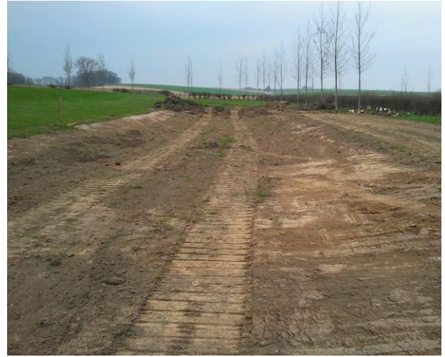
Overloopzone aan andere kant van Henisdaelstraat (Vechmaal)