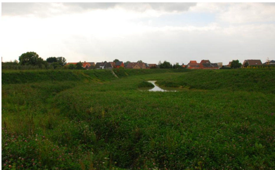
Foto 2: zicht op dijk, poel en gecontroleerde overstromingszone 1 (september 2014)