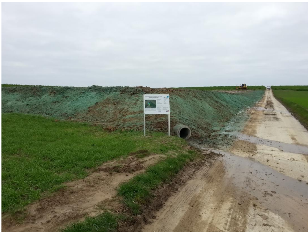
Foto : Zicht op het perceel na de werken