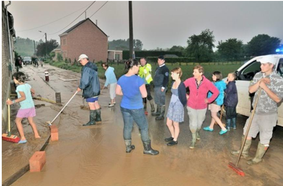
Water- en modderoverlast in Widooie - Mei 2012

Water- en modderoverlast in de Weeraardstraat te Widooie is een regelmatig terugkerend probleem. In het voorjaar van 2012 werden de inwoners wederom geconfronteerd met water- en modderoverlast. Het water en de modder stromen van de hoger gelegen landbouwpercelen af richting de woningen in de Weeraardstraat. Bij hevige regenval vloeit er dus heel wat vruchtbare grond weg. Bovendien stroomt het modderwater ook in de riolering met dichtslibben van de buizen en schade aan de waterzuiveringsinfrastructuur tot gevolg. Er moesten dus maatregelen genomen worden om de woningen te beschermen en het inspoelen van modder in de riolering te beperken.