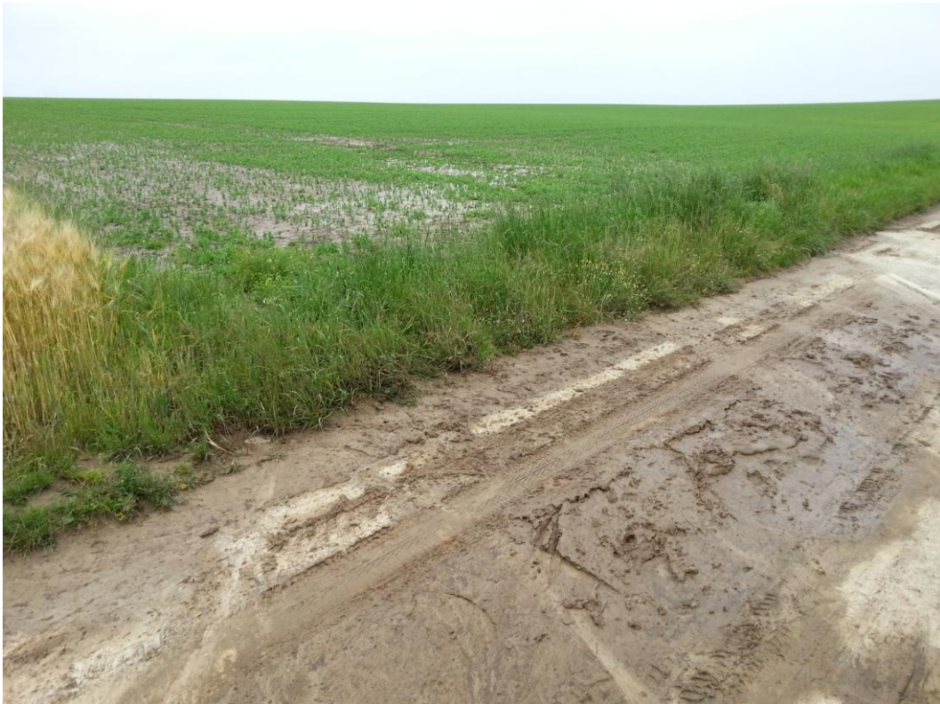
Foto : Zicht op het perceel vóór de werken